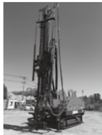
施工機 (GI-130C-HT-K) ▶P.15