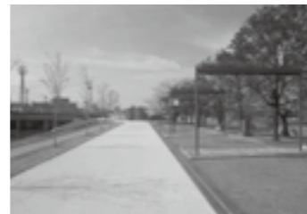
千年の桜並木と可動式テント▶P.9