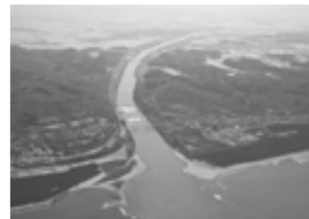
大河津分水路全景▶P.5