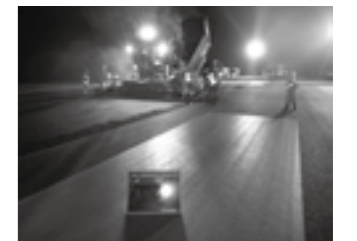
滑走路の舗設作業▶P.23